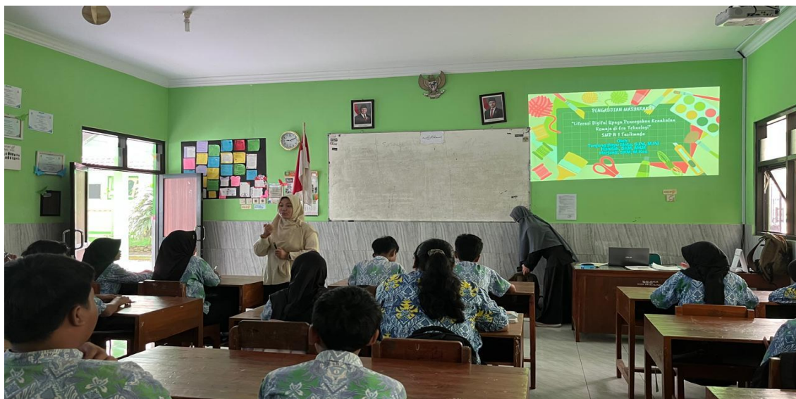
Gambar 1. Dosen memberikan materi

tantangan. Banyak remaja menjadi lebih individualis dalam berinteraksi secara langsung serta terpengaruh oleh konten negatif di internet. Selain itu, munculnya media sosial sering kali memicu perilaku tidak sehat seperti membandingkan diri, mencari pengakuan berlebihan, hingga terlibat dalam kenakalan seperti perundungan atau penyebaran konten yang tidak pantas (Putra, 2024).