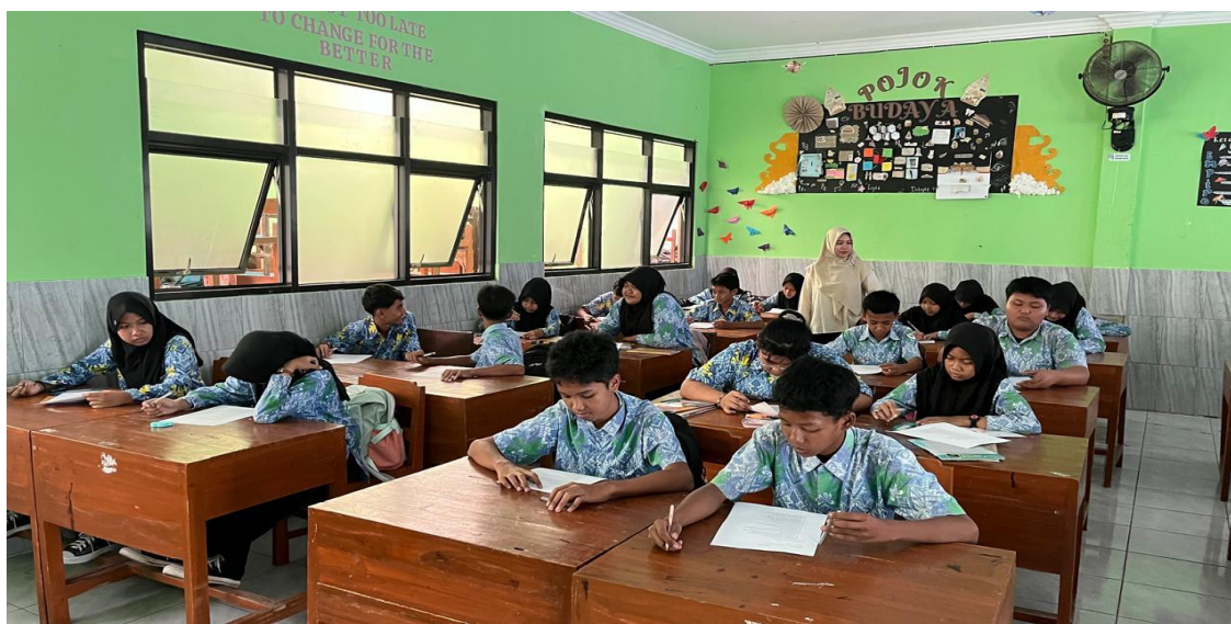
Gambar 2. Pengerjaan post test siswa

sosial di dunia nyata. Mereka perlu belajar menyaring informasi yang diterima sebelum mempercayai atau menyebarkannya dengan cara memeriksa kebenaran sumber berita dan menghindari konten yang provokatif. Teknologi seharusnya dimanfaatkan untuk hal – hal positif, dengan bersikap bijak dan bertanggung jawab remaja dapat menjadi teladan digital yang mampu menggunakan teknologi untuk mendukung masa depan yang lebih baik.