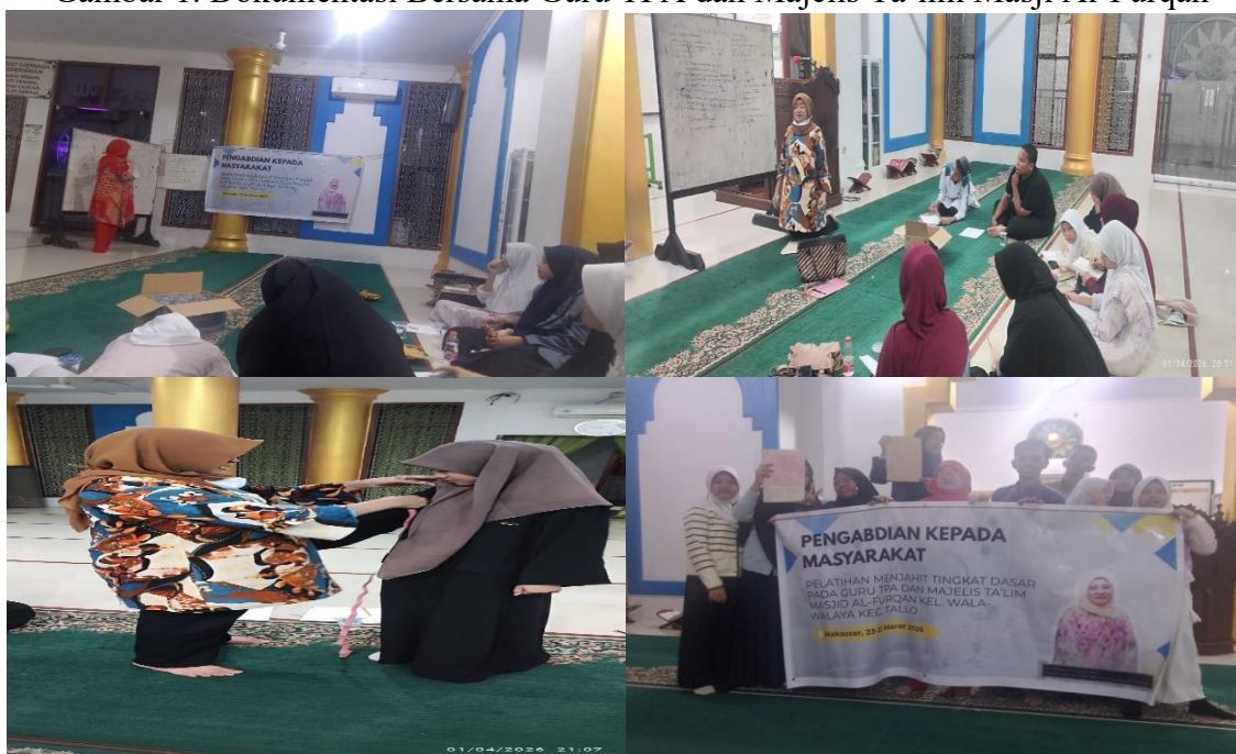
Gambar 1. Dokumentasi Bersama Guru TPA dan Majelis Ta'lim Masji Al-Furqan